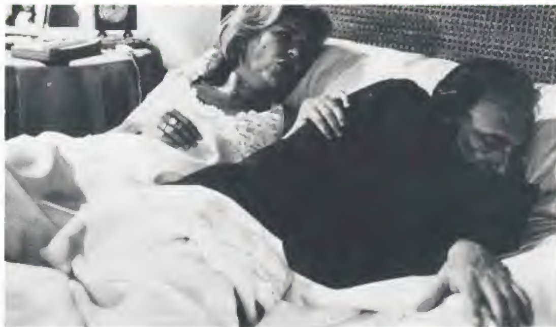
Amparo Soler Leal - Héctor Alterio